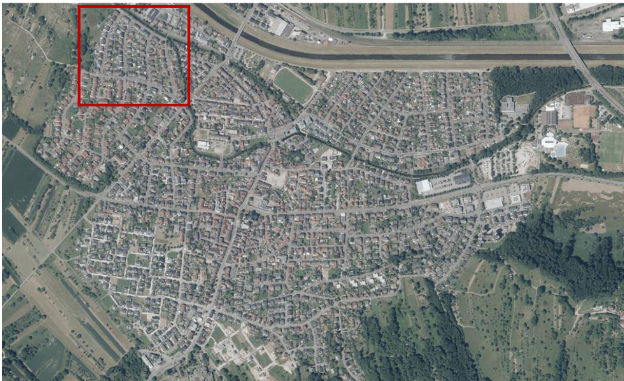
Luftbild (ohne Maßstab)